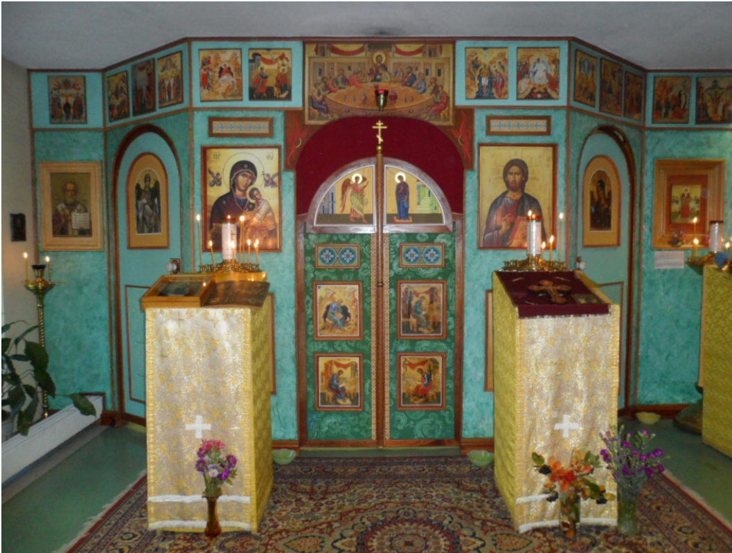
Pyhän Ksenia Pietarilaisen kirkko Helsingin mellunmäessä